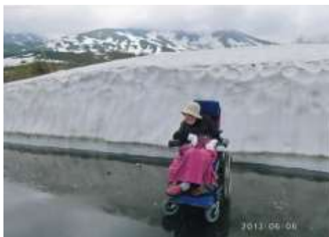
美幌の展望台の雪

5人共ガッカリ！！急にお腹がグーグー鳴り出しました。きっとお腹の虫もガッカリしたのでしょうか。誰かが一口饅頭をおやつに持っていたので、それを2個ずつみんなで分