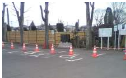
けいだい しんしやうしやようちゆうしやじよう 境内の身障者用駐車場 みぎおく たなかしょうぞう ほか 右奥は田中正造の墓

ほんどう まえ さいせん あ まい 本堂の前でお費錢を上げてお参りしてい ひと る人はあまりなくて、本堂に上がって きとう う けてい りるひと 祈禱を受けている人がたくさんいました。 じっさい み かくにん くるま 実際に見ては確認していませんが、車い すでほんどう あ すで本堂に上がることもできるよう むりよう ちゆうしやじよう ちか 無料の駐車場は近くにたくさんありま ひと で きんじよ いえ ゆうりよう す。人出があるときは近所の家が有料の