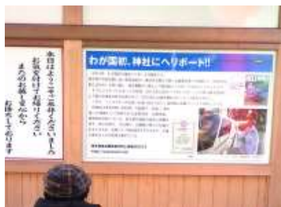
くにはつ じんじや わが国初、神社にヘリポート！！