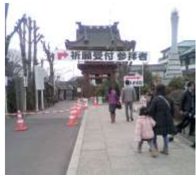
黄金じゃない方の鐘撞き堂

だいぶ普段の状況に近くなったかと思っていたのですが、まだ初詣の雰囲気は残っていて、露店が並び駐車場では係員が車を誘導していました。大型バスで遠方から来ている人も結構いるようでした。やっぱり厄除け祈願が目的の人が多そうです。