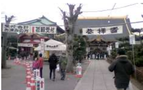
佐野厄除け大師 右が本堂

めずらしく今年は初詣にいろいろと行ってきました。その一つは以前機関誌で紹介した二荒山神社、その他に佐野厄除け大師、高根沢町の安住神社にも行きました。今回調べてみて初めて知りましたが、佐野厄除け大師の正式な名称は、春日岡山惣宗寺らしいです。