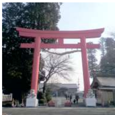
やすずみじんじや おおとりい 安住神社の大鳥居

やすずみじんじや さくねん し 安住神社は昨年知ったばかりのところ で、ねんまつ すが、年末に500kgのジャンボ鏡餅を ほうのう ゆうめい 奉納することで有名らしい。そして、行っ てみておどろ 驚いたのはヘリコプターのお祓い もしますということ。ヘリポートもちゃん とあります。た なか おお あか とりい 田んぼの中に大きな赤い鳥居 がみ えてくるので、ちか まで い けば み つけ やすいです。