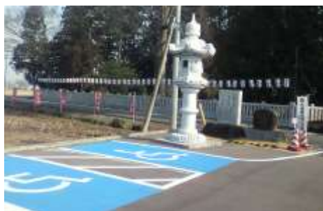
しんしやうしやようちゆうしやじよう 身障者用駐車場

おうごん こまいぬ 黄金の狛犬というのもあったらしいです が、みわす 見忘れてしまいました。さん には、ひと まい くるらし く、しゅうへん のうどう わき くるま 周辺の農道の脇に車がびっしり止まっていて、それがかなり遠くま でつづ で続いているそうです。しかし普段は駐車場もあり、境内もほとんど平ら なのでお参りしやすいです。じかよう も かた 自家用ヘリをお持ちの方にもおすすめです。