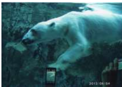
あさひやまどうぶつえん 旭山動物園のホッキョクグマ

ここに1時間ちかくいて今度は富良野のお花を求めて美しい山々に別れを つ 告げて出発しました。